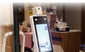
AIサーモカメラでの検温