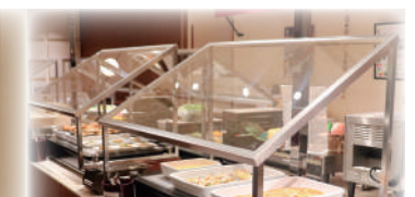
飛沫防止スニーズガードの設置

その他、スタッフのマスク着用による定期的な消毒の実施、空気循環システムにより店内の空気は1時間あたり9回入れ替わります。