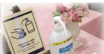
店舗入り口での手指消毒のお願い