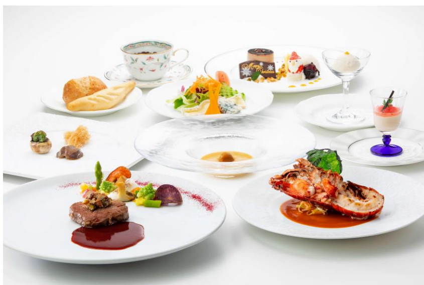
「クリスマススペシャルディナーコース ホーリーナイト」