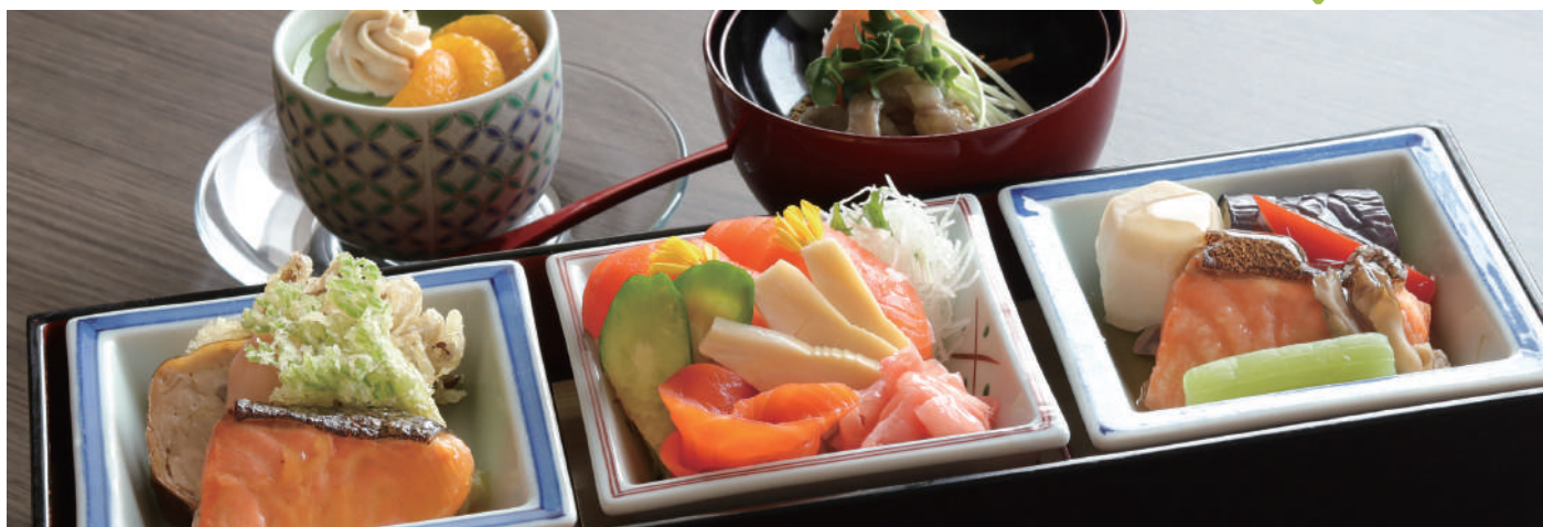
阿武隈川メイプルサーモン御膳