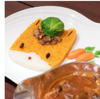
【限定10食】ぐんまちゃんカレー