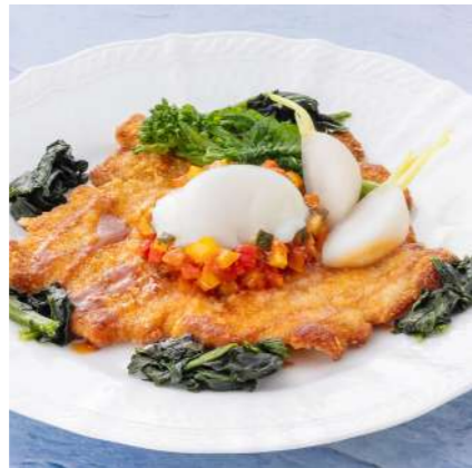
高崎産えばらハーブ豚未来ロースの カツレツ 温玉添え