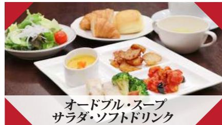
オードブル・スープ サラダ・ソフトドリンク