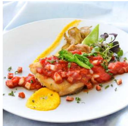
国産鶏モモ肉のソテ カチャトラ風

バイキングのみのお子様【小学生】¥1,500 / 【3歳～小学生未満】¥1,000