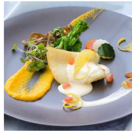
白身魚のソテ モナコ風