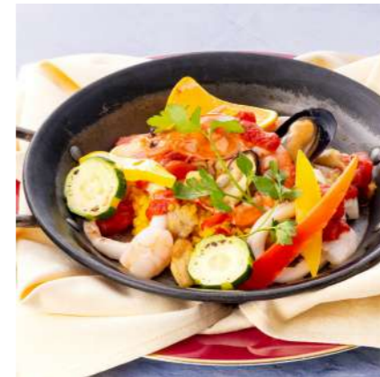
パエリア バレンシア風

※「えび・かに」は原材料として使用しておりませんが、しらすの採取漁法により稀に混入する場合がございます。