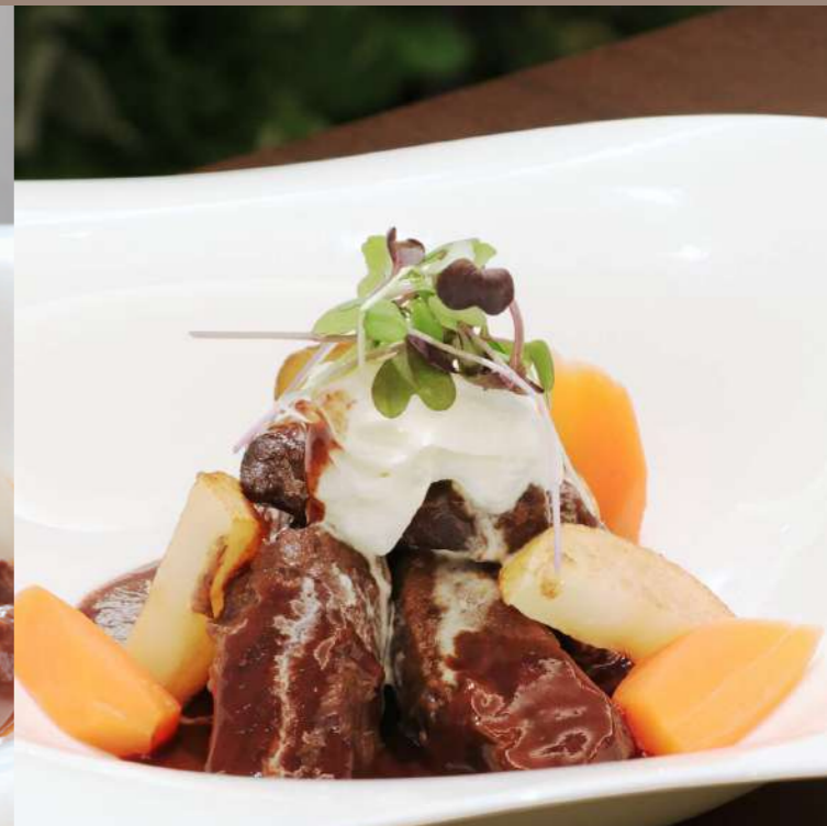
上州ジビエ群馬県産ニホンジカの赤ワイン煮込み リヨン風 ¥3,600

芳醇な香りと奥深い味わいが特長で、リヨン風のやさしい酸味がジビエ特有の風味と絶妙に調和します。地元食材の魅力を最大限に引き出した一皿として、上州ジビエの新たな味覚体験を是非お楽しみください。