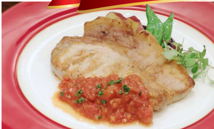
◎高崎産えばらハーブ豚未来ロース ソテ