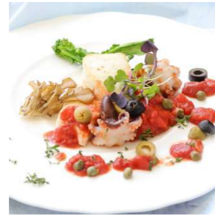
メカジキとイダコのポワレ コルシカソース