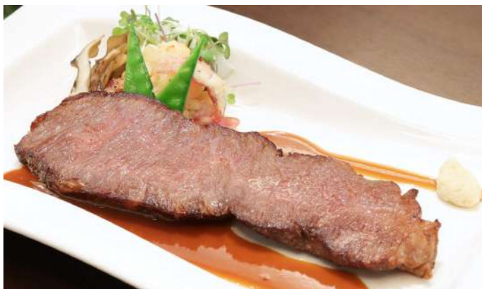
◎上州牛ロースグリル