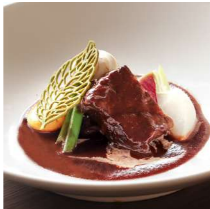
ホテルメトロポリタン高崎伝統の 上州牛ビーフシチュー