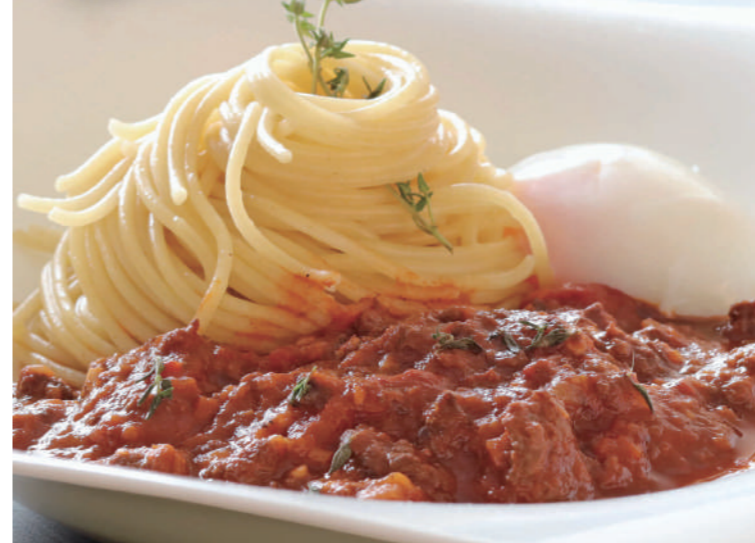
上州ジビエ群馬県産ニホンジカのミートソーススパゲティ ¥2,800

群馬県産ニホンジカを使用しオリジナルのトマトソースでじっくり煮込み、シカ肉の旨味が凝縮されたミートソースと温泉玉子を少しずつ絡めながらお召し上がりいただくことにより一皿で二つの味をお楽しみいただけます。