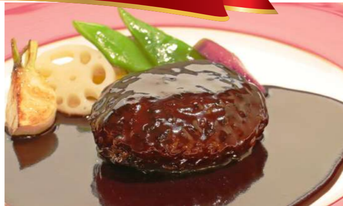
上州牛と高崎産えばらハーブ豚未来のハンバーグステーキ