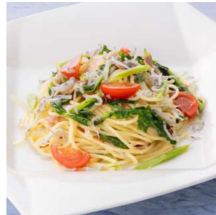
シラスと夏野菜の ペペロンチーノ