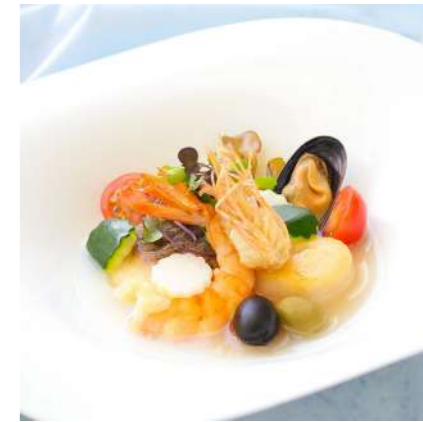
ホタテと有頭海老、白寿真鯛の アクアパッツァ仕立て