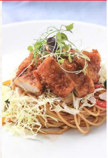
妻有ポークの ソースカツスパゲティ .....¥2,500