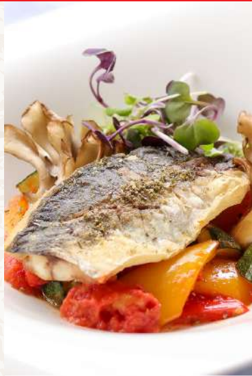
新潟県産鯉のプロヴァンス風 ラタトゥイユソース .....¥2,800