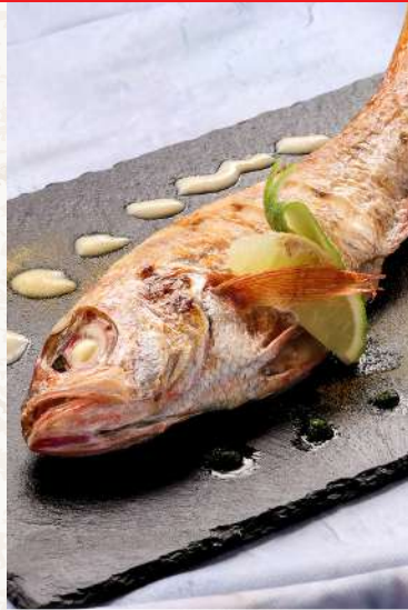
新潟県産のどぐろのグリル アグリユームアロマ .....¥8,000