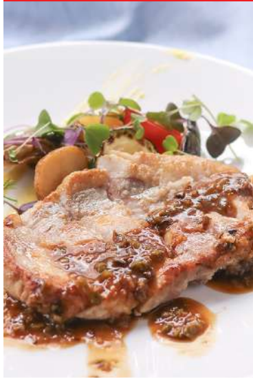
妻有ポークのソテ ピカントソース .....¥3,200